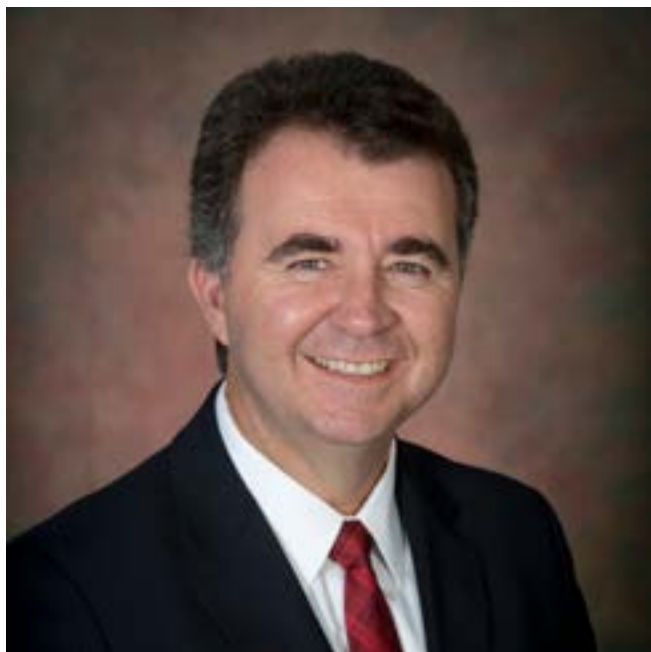
Jorge Pohlmann Nasser

O mercado de seguros já pagou, no Brasil, cerca de R$ 4,6 bilhões em um total de 90 mil indenizações por mortes decorrentes da pandemia. Os dados foram revelados pelo presidente da Federação Nacional de Previdência Privada e Vida (FenaPrevi), Jorge Pohlmann Nasser, durante o 8º Encontro Anual do Clube de Seguros de Pessoas de Minas Gerais (CSP-MG), no dia 23 de setembro.