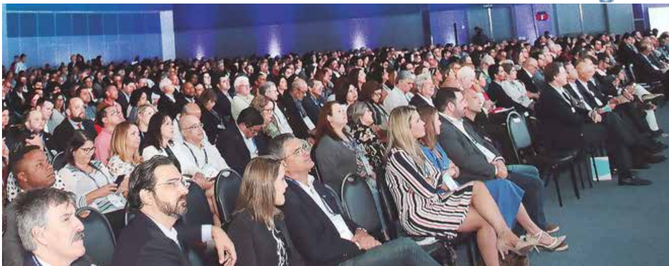
Audiência em alta. Um público de mais de 1,3 mil pessoas, a maioria corretores de seguros, prestigiou o encontro