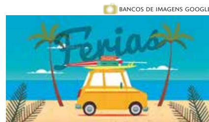
BANCOS DE IMAGENS GOOGLE

As férias de verão estão chegando e também a hora de pegar a estrada e viajar com a família. Mas é preciso alguns cuidados para que tudo saia conforme o planejado. Algumas dicas importantes foram listadas pela Seguralta, para que você, corretor, possa orientar seus clientes a deixar a casa protegida e curtir as férias sem contratemplos: a) avise a vizinhos e familiares sobre o período de sua ausência; b) certifique-se de que todas as portas e janelas foram devidamente fechadas e trancadas e se