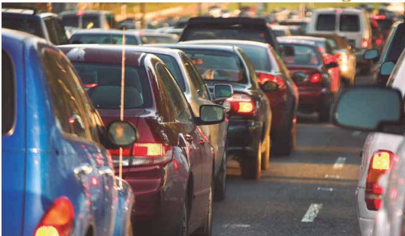
■ Acidentes de trânsito: Nos últimos dez anos, em todo o Brasil, foram pagas 4,5 milhões de indenizações às vítimas