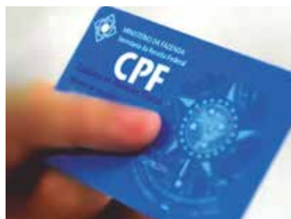
BANCOS DE IMAGENS GOOGLE

O Serasa Consumidor, braço da Serasa Experian voltado ao cidadão, fechou parceria com as Lojas Americanas para disponibilizar serviços de consulta ao CPF e ao CNPJ em 337 lojas da rede, espalhadas pelo país. Pelo serviço, a população poderá verificar o próprio CPF e Score de crédito para identificar a existência de dívidas em seu nome e saber como o mercado de crédito enxerga sua capacidade para pagar dívidas. Além,